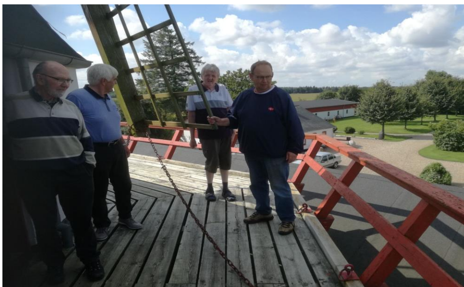
Mandeklubben på udflugt

Alle arrangementerne afsluttes med frokost. Ofte er menuen rugbrødsmadder og en lun ret i kirkecenteret, men herrerne nyder også at spise ude. Mange af de enlige mænd kommer ikke så ofte ud at spise, så det er dejligt at få dagens ret på en kro i selskab med andre.