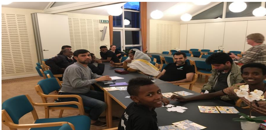
Verdenscaféen i Farsø

de. Dernæst tog vi kontakt til den lokale sprogskole for at spørge, om de ville dele indbydelsen ud til eleverne. Det ville de meget gerne, og siden har vi mødt stort opbakning fra lærerne, som har mindet eleverne om at komme afsted, ligesom flere af dem har deltaget i vores arrangementer.