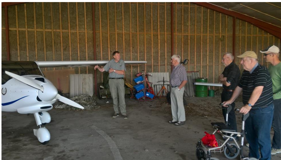
Mandeklubben på udflugt