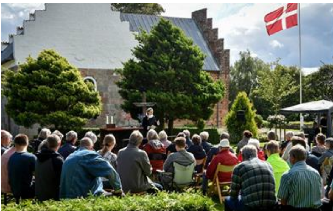
Vissing udealter ved Reformationsfejringen

Planlægningen af arrangementet var startet allerede i april måned, og i den forbindelse indførte vi det interne arbejdspapir.