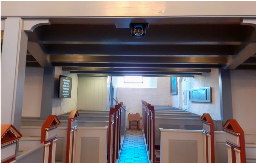
Kamera til streaming af gudstjenesten samt placering af skærme i den bagerste del af kirken.