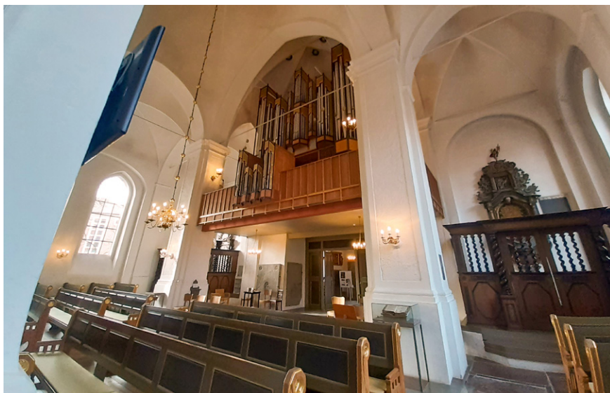
Orgelet i Sankt Nicolai kirke.

til kirkerummets formidling af højtidelighed, og fra vores feltbesøg mindes vi, at en yngre kirkegænger i 10-års alderen, der sad med sin familie nogle rækker foran os, nærmest lettede fra bænken, da orgelets stærke lyd blæste ud i rummet. 50