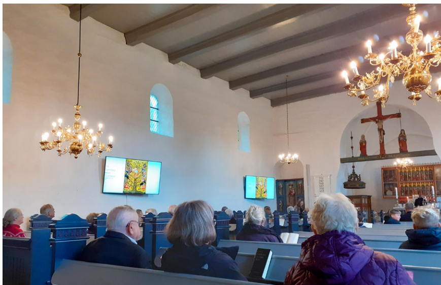
Kirkegængere, skærme, salmetavler og salmebøger i Felsted kirke.

ophængte kunstværker. Det er også sådan, at billedbrugen er tænkt ifølge Theresia. Hun fortæller, at hun betragter skærmbrugen som det at hænge et billede op. 27 I et materialitetsperspektiv indgår skærmene dermed også som en teknologi, der minder tilskueren om den lange kunsthistorie, som kirken er en del af.