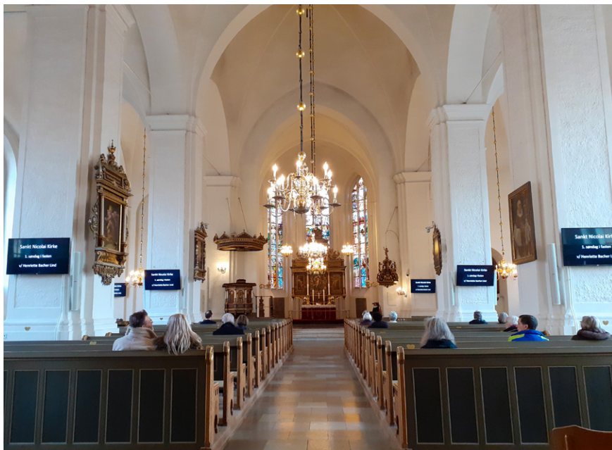
Skærmene hænger centralt og symmetrisk i Sankt Nicolai kirke.

Sankt Nicolai kirke har syv skærme. Der hænger én skærm på hver af de fire søjler op igennem kirkeskibet, og så hænger der to nede for endevæggen plus én i søndre korsarm. Alle sammen peger de imod kirkebænkene. De fleste er placeret samme sted som de tidligere salmetavler. Dog er de to skærme ved sideskibene placeret på vippebeslag, som kan vinkles efter behov. Ledninger til skærmene er gemt i hvide kabelskjulere af plastik, så de så vidt muligt falder i et med de hvide søjler. De sorte skærme hænger sammen med hvide højtaleranlæg. Derudover er der sat kameraer op, så det er muligt at filme begivenhederne ved døbefonten, altertavlen, kortrappen, prædikestolen samt ved orgelet. Kameraerne bliver brugt til at 'live streame', så det er lettere at følge med i begivenhederne fra de positioner i kirkerummet, hvor udsynet er spærret af kirkens søjler og rummets vinkler.