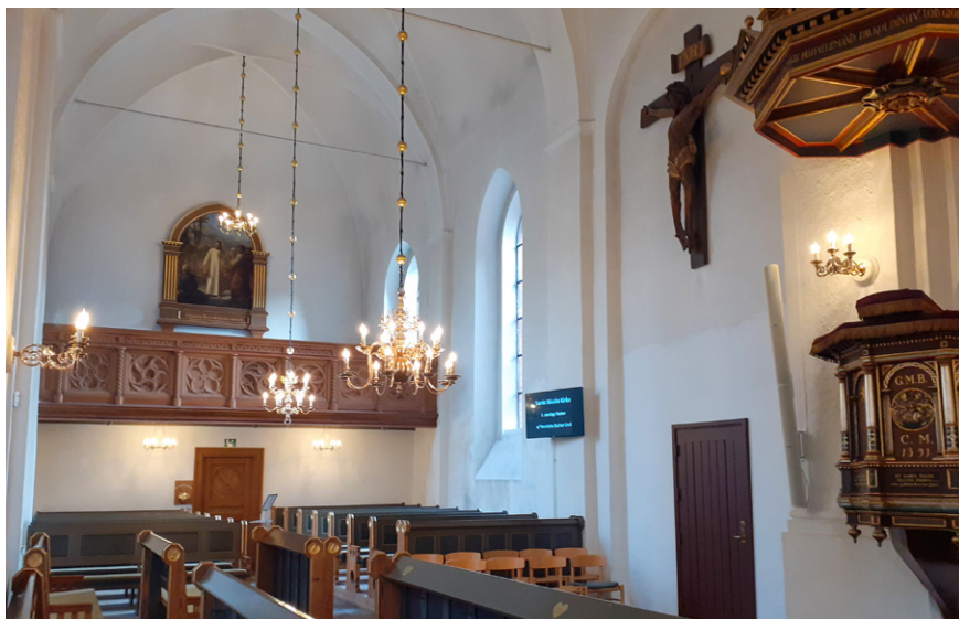
På billedet ses bl.a. prædikestolen, den ene af kirkens to korsarme og pulpituret. Udsynet er begrænset fra disse pladser i kirken.