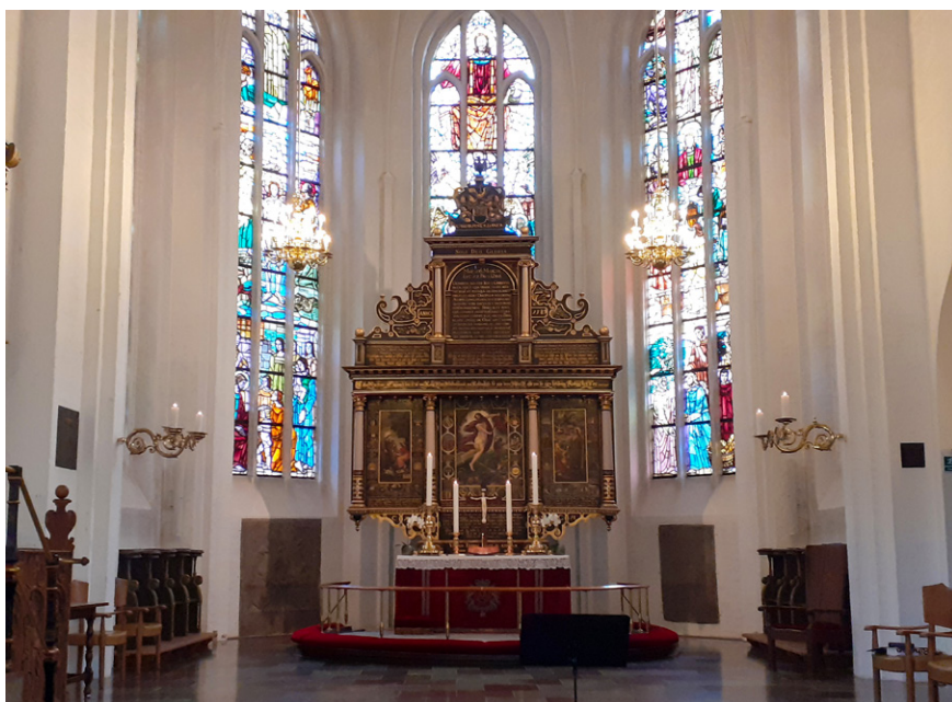
Altertavlen i Sankt Nicolai kirke med de flotte glasmalerier som ramme.