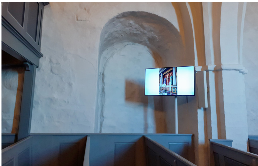
Skærmens lys og teknologiske materialitet i det middelalderlige kirkerum.

tør snakke med hinanden. Det betyder, at der er en venlig og varm atmosfære folk og folk imellem. Men når kirkeklokkerne lyder, så falder roen på, og så kommer den der andagt og stilhed. 76