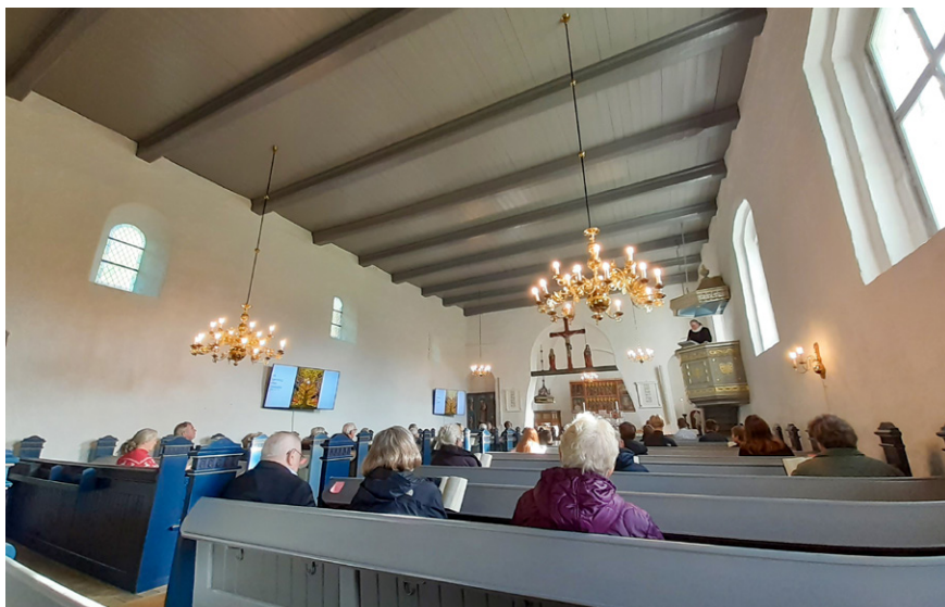
Skærmene illustrerer dagens prædiken.