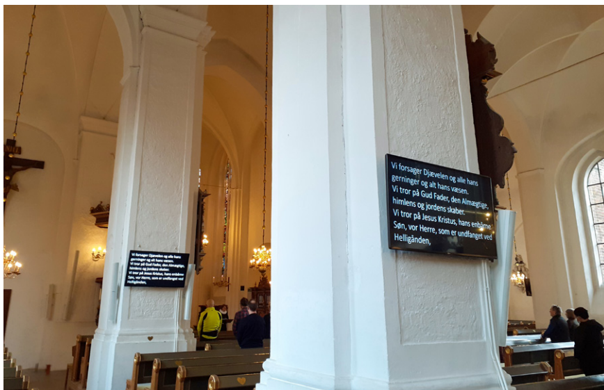
Trosbekendelsen fremvises på skærmene i Sankt Nicolai kirke, sådan at hele kirkens menighed har mulighed for at bekende sin kristne tro.

ette Bacher Lind siger følgende om skærmenes formål og om selve beslutningsprocessen: