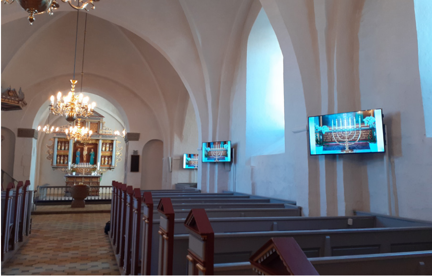
Skærmene er monteret på standere, sådan at de ikke sidder fast i væggen. Her ser vi det streamede billede fra alteret på skærmens flader.